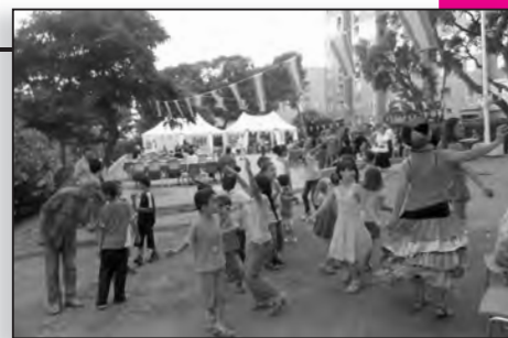
Nombreuses activités proposées, ce 25 juin, à destination des enfants de Paese Novu...