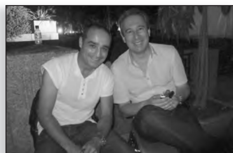
Discussion en compagnie de l'ami « Pido »