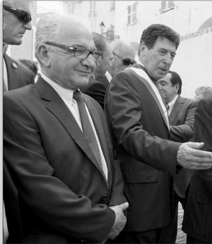
Arrivée au Palais des Gouverneurs dans la rénovation duquel l'Etat a sa part

autre savon...». Soulignant la part déjà prise par l'Etat à la revalorisation des outils culturels de la Ville (3,7M€ pour le Musée de Bastia et le Palais des Gouverneurs), Frédéric Mitterrand a d'emblée replacé ceux-ci dans un contexte plus large, en en soulignant la portée : «La Corse est vraiment le cœur de la Méditerranée. Elle en reçoit le sang culturel et lui redonne sa propre culture. Le Musée de Bastia est l'héritier d'une grande tradition culturelle et savante. Sa réouverture tra-