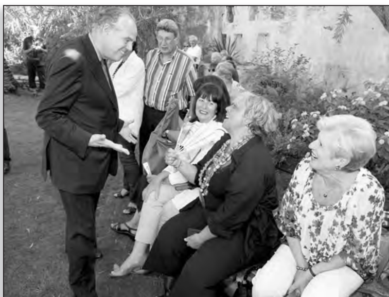
Dans les jardins suspendus, conversation à bâtons rompus avec la gent féminine