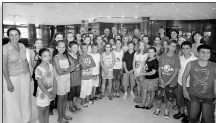
Les jeunes et heureux gagnants de "Lire, c'est classe"