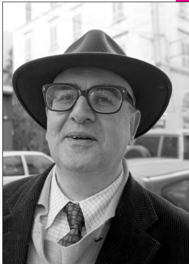
Me Trani apporte sa pierre au débat sur le foncier

Il convient également d'envisager la création d'un Juge Foncier statuant en matière gracieuse au vu des documents soumis et permettant la publication du titre de propriété auprès de la conservation des hypothèques et chargé de la surveillance de la publication par assimilation au registre foncier, étant donné l'urgence, dans l'attente de la création ultérieure d'un registre foncier.