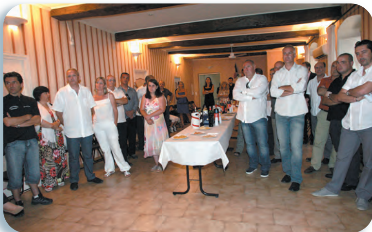
Parmi l'assistance, de nombreux pompiers et amis du colonel

réussite aussi méritoire de l'un des enfants de la commune.