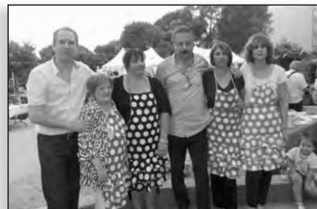
...sous l'impulsion de l'association de défense des locataires du quartier et des élus bastiais