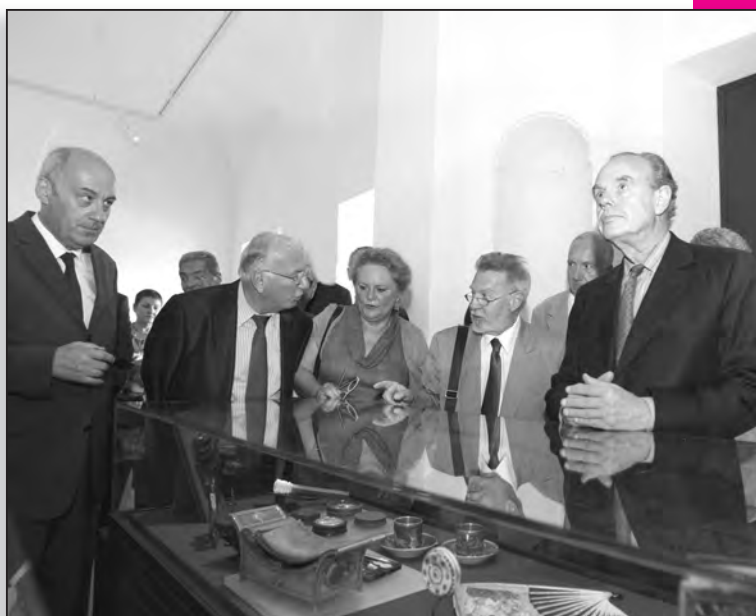
Le Musée de la Ville de Bastia laisse son visiteur rêveur...