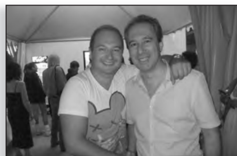
Avec Cauet, l'animateur vedette d'NRJ