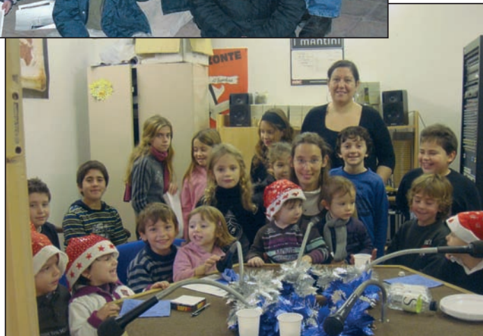
Sur la radio associative Voce Nustrale, les enfants ont été les petits rois des fêtes de fin d'année