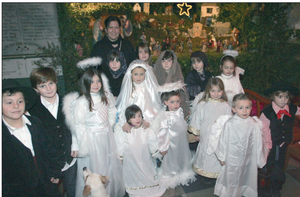
A Cervioni, la crèche vivante fait la beauté de la messe de minuit

Scintillant, gourmand, chaleureux, joyeux... Noël est passé dans les foyers, a semé du bonheur dans les écoles, de l'espoir chez les plus démunis, du rire sur les ondes de la radio locale Voce Nustrale, de la sincérité dans les églises. Avec la venue du babbu natale, autour de la naissance de l'enfant Jésus, entre gourmandises et recueillement, du profane au sacré, Natale nous enchante et nous fait rêver.