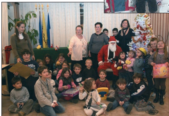
Le secours catholique de Cervioni a organisé une chaleureuse fête de Noël